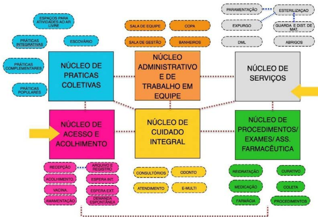
Figura 1: Diagrama de Massas